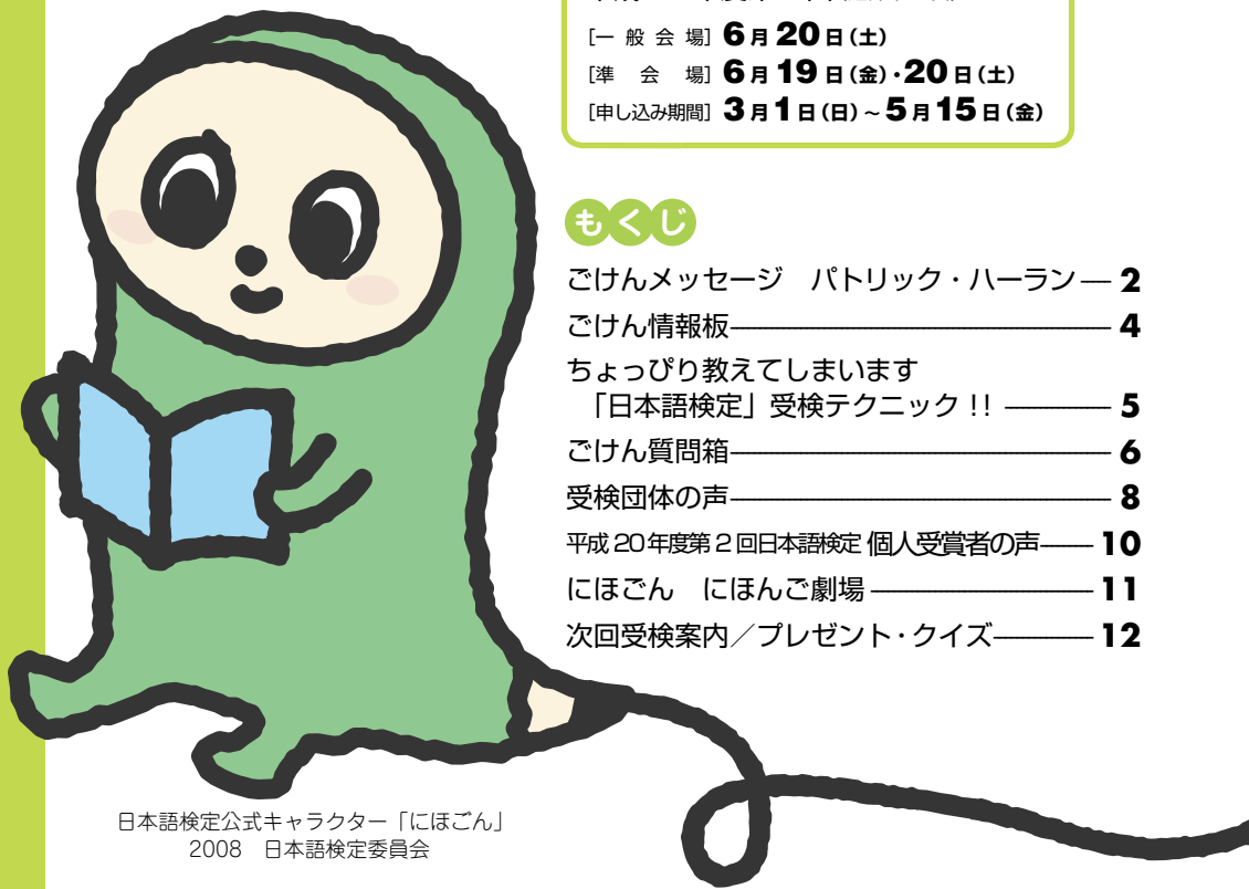
日本語検定公式キャラクター「にほんごん」 2008 日本語検定委員会