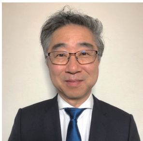
明海大学外国語学部 日本語学科 教授

最後に、日本語が母語でない学生を指導していると、改めて言葉の力や奥深さに気づくことがあるという。日本語を知識として覚えるだけではなく、日本語の素晴らしさへの気づきや再発見の契機となることも日本語検定の大切な役割の一つなのではないか、と言葉を結んだ。