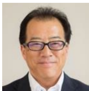
桜の聖母短期大学 キャリア教養学科教授

また卒業の質保証の観点から CP（カリキュラム・ポリシー）や DP（ディプロマ・ポリシー）の策定と遵守も求められる時代です。そこに遠隔授業が入ってきました。今後は、対面と遠隔のハイブリッド型が定着すると予想できます。遠隔授業の質を担保する必要があります。遠隔授業は「話す」「聴く」「読む」「書く」という日本語力の質が浮き彫りになる授業です。ID（インストラクショナル・デザイン）に基づく詳細設計・実践と質向上は教員の責務です。教育機関には学生の日本語力の弱点を正確に把握でき、日本語力を伸ばすことのできる仕組み作りと改善が、従来にも増して求められているといえるでしょう。