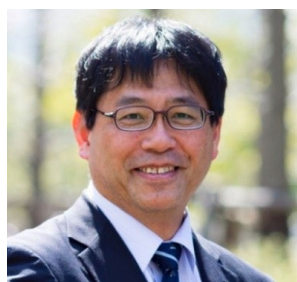
帝京平成大学 現代ライフ学部 教授

日本は、この新型コロナウイルスによって多大な環境変化を余儀なくされましたが、「日本語(言葉)」を使い、相手とコミュニケーションを取ることは、日本語の豊かな世界を広げる契機とすることもできるのではないのでしょうか。そのために「日本語検定」の果たす役割は大きいと考えます。