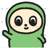
日本語検定公式キャラクター にはごん