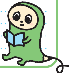
日本語検定公式キャラクター にはごん