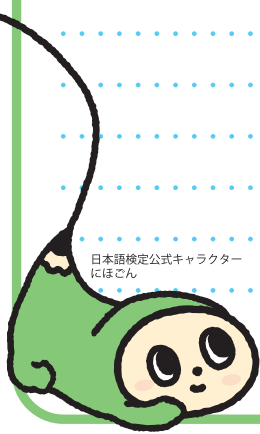
日本語検定公式キャラクター にはごん